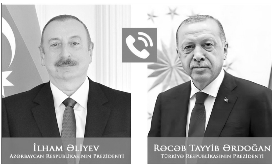
İLHAM ƏLİYEV AZƏRBAYCAN RESPUBLİKASININ PREZİDENTİ