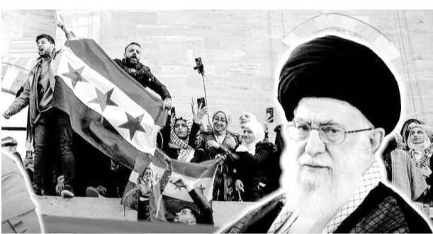
"İndi Ermənistan çıxılmaz vəziyyətdədir. Ermənistan Türkiyəyə daha çox etibar edir, nəinki İran və Rusiyaya..."

"İnanıram ki, bu, Paşinyanın ideyasıdır. Yeni Paşinyan buranı türk-azərbaycanlı qardaşlarımızla bölüşmək qərarına gəlib. O, azərbaycanlıların burada yaşaması üçün danışıqlar aparır, ermənilərin getməsindən isə söhbət gəde bilməz, ona görə də Ermənistan hakimiyyətinin yerinə türk vassallarını görürük. İran varsa, hansısa təhlükəni zərərsizləşdirə bilərdik, ancaq indiki hökumət İranın müdaxiləsinə imkan verməyəcək". Bağratyan deyib ki, azərbaycanlılar yalnız Zəngəzurla kifayətlənməyəcək, Bakının hədəfi Qərbi Azərbaycandır: "Bu 2,8 milyon insan Qərbi Azərbaycan İcmasının nümayəndələri ilə danışıqlar şəxslər seçməli və onlardan neçəsinin kəndə, neçəsinin şəhərə gələcəyinə qərar verilməlidir.