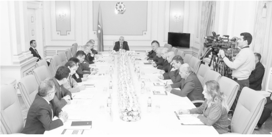
Seçkiqabağı təşviqat gələn il yanvarın 6-da başlayacaq

Gələn il yanvarın 29-na təyin edilən bələdiyyə seçkiləri ilə əlaqədar seçkiqabağı təşviqat 2025-ci il yanvarın 6-dan başlayacaq. Bu, Azərbaycan Respublikasında bələdiyyə seçkilərinin hazırlanmış keçirilməsi üzrə əsas hərəkət və tədbirlərin Təqvim Planında əksini tapıb. Seçki Məcəlləsinin müvafiq maddələrinə əsasən, qeydə alınmış namizədlər, namizədi qeydə alınmış siyasi partiyalar, siyasi partiyaların blokları, vəkil edilmiş şəxslər, səlahiyyətli nümayəndələr tərəfindən seçkiqabağı təşviqat səsvərmə gününə