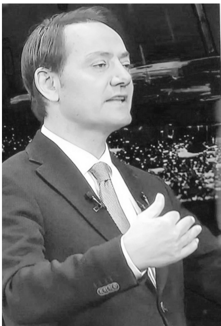
Azərbaycan və Ermənistan arasında sülhün imzalanması və münacişəyə son qoyulması dünyanı maraqlandıran əsas məsələlər sırasındadır.

İki ölkə arasında dayanıqlı sülhün bərqərar olması və münasiblərin normallaşması üçün Ermənistan Konstitusiyasında dəyişikliklərin edilməsi, Azərbaycanca qarşı ərazi iddiasının ləğv edilməsi zəruri şərtidir. İrəvan hakimiyyəti isə qonşuları ilə normal davranmaq əvəzinə, siyasi manipulyasiyaya və silahlanmağa üz tutmaq yolunda irəliləyir.